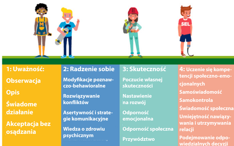
Rys. 2. Program DOBROSTAN DLA NAS składa się z 4 komponentów i 18 umiejętności.

Ramy konceptualne UPRIGHT składają się z czterech różnych komponentów: uważność, radzenie sobie, skuteczność i uczenie się kompetencji społeczno-emocjonalnych, obejmujących 18 umiejętności.