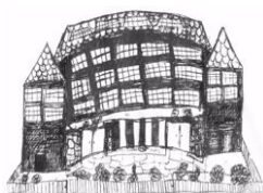
Zespół Szkół nr 9