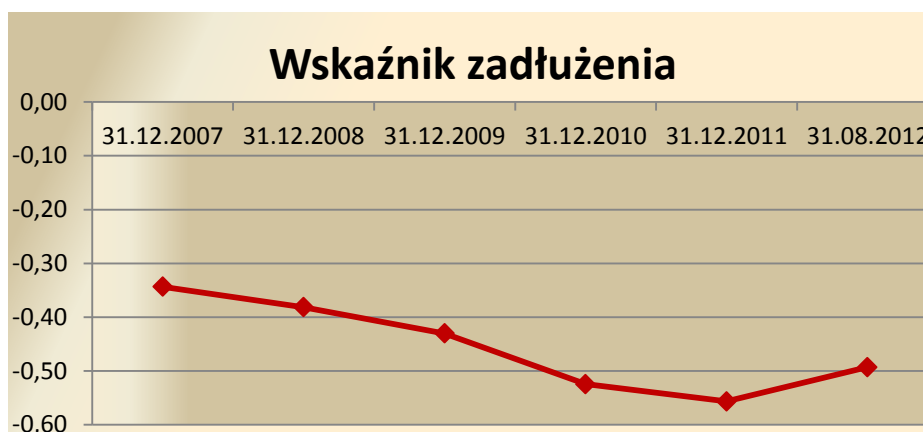
Wykres nr 3 . Zmiany poziomu wskaźnika zadłużenia 3 w latach 2007-2011

W prezentowanym okresie w Zakładach nie występowały problemy z płynnością finansową, wszystkie zobowiązania spłacane są w terminie. Wskaźnik zadłużenia jest ujemny, co oznacza, że środki pieniężne pozostające w dyspozycji są większe od kwoty zobowiązań.