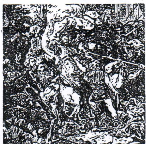
FRAGMENT Z OBRAZU „GRUNWALD“ JANA MATEJKI

W ROKU 1410 dnia 15 lipca, połączone wojska polskie, litewskie, smoleńskie, kijowskie, czeskie i morawskie, silne swoją jednością stoczyły na polach Grunwaldu zwycięski bój ze śmiertelnym wrogiem Słowiańszczyzny – krzyżakami. W ROKU 1945, kiedy bohaterstwa walką Narodu polskiego literowała Krajowa Rada Narodowa, żołnierz polski walczyć ramię przy ramieniu z żołnierzem radzieckim, stanął z nim jako zwycięzca na gruzach Berlina. Na wszystkich polach walki i na ziemi ojczystej Polacy zmagali się przez blisko 6 lat po bohatersku ze swym odwiecznym wrogiem. Po latach ciężkiej walki z niemiecką, narody milujące w wolność z wielkim Związkiem Radzieckim na czele, rozgromili Niemcy, ratując świat przed barbarzyństwem faszystowskim. Drugi Grunwald przyniósł ojczyźnie wolność, demokrację i powrót Ziemi Zachodnich do Macierzy. Odznaka Grunwaldzka jest symbolem zwycięstwa nad Niemcami.