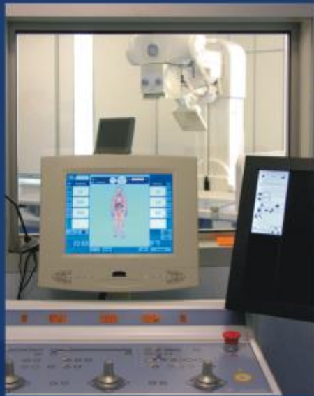
Zakupiony aparat wielofunkcyjny USG pozwala na najostrejsze obrazowanie i pełną gamę badań w diagnostyce ultrasonograficznej