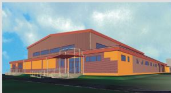
Wizualizacja sali sportowej w Gromadce

Wkład Europejskiego Funduszu Rozwoju Regionalnego w tę inwestycję wyniesie ponad 3 mln 855 tys. zł. Gmina dołoży do budowy więcej niż zakładała, bo ponad 1,1 mln zł, ponieważ po przetargu sala przewyższyła wartość kosztorysową.