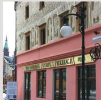
Pracom konserwatorskim poddana została Kamieniczka Scholza, odrestaurowane zostały dekoracje sgraffitowe – renesansowa perelka legnickiego centrum miasta