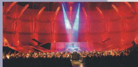
Spektakle Festiwalu Wagnerowskiego we Wrocławiu zobaczy kilkanaście tysięcy widzów