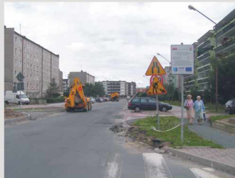
Modernizacja ulic Kiepury i Noskowskiego ma też poprawić komunikację osiedla Zabobrze ze skrzyżowaniem z główną ulicą w mieście - Jana Pawła II (ciąg drogi krajowej nr 3)

Projekt Legnicy ma nie tylko poprawić standard linii