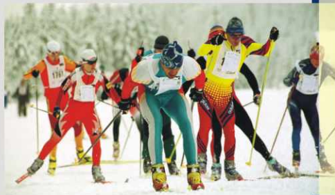
Karkonosze to jeden z najważniejszych obszarów turystycznych Dolnego Śląska, o doskonałych warunkach dla rozwoju różnych form turystyki aktywnej, w tym: narciarstwa i sportów zimowych oraz turystyki pieszej

Turystyczne atrakcje Dolnego Śląska, które w efekcie realizacji projektu staną się produktami markowymi, to: Karkonosze i turystyka aktywna, pałace, zamki i dziedzictwo kultury Dolnego Śląska, uzdrowiska dolnośląskie, Cystersi na Dolnym Śląsku oraz turystyka pielgrzymkowa, dolnośląskie podziemia i fortyfikacje agro- i ekoturystyka dolnośląska, turystyka weekendowa, biznesowa i konferencyjno-kongresowa.