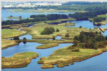
O atrakcyjności agro- i ekoturystyki na terenie Dolnego Śląska stanowią przede wszystkim unikalne walory krajobrazowe środowiska przyrodniczego. Na zdjęciu stawy milicjkie

Z uwagi na bogate walory przyrodnicze oraz unikatowe dziedzictwo kulturowe i historyczne Dolnego Śląska turystyka staje się