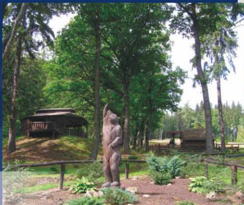
W Jedlinie Zdrój w rejonie istniejącego stoku narciarskiego powstanie m.in. całoroczny tor saneczkowy z rynną o długości około 450 m