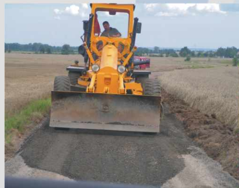
Projekty drogowe w ramach ZPORR na Dolnym Śląsku realizują:

Ponad 50 projektów drogowych to inwestycje niewielkie, realizowane w ramach Działania 3.1 ZPORR „Obszary wiejskie”. Jednym z nich jest „Odbudowa i modernizacja drogi gminnej Przybyłowice-Słup” gminy Męcinka. To mała, ale też aktywna, jeśli chodzi o pozyskiwanie zewnętrznych środków, gmina. Jak mówią mieszkańcy - wójt Zbigniew Przychodzeń, ma milion pomysłów na projekty.