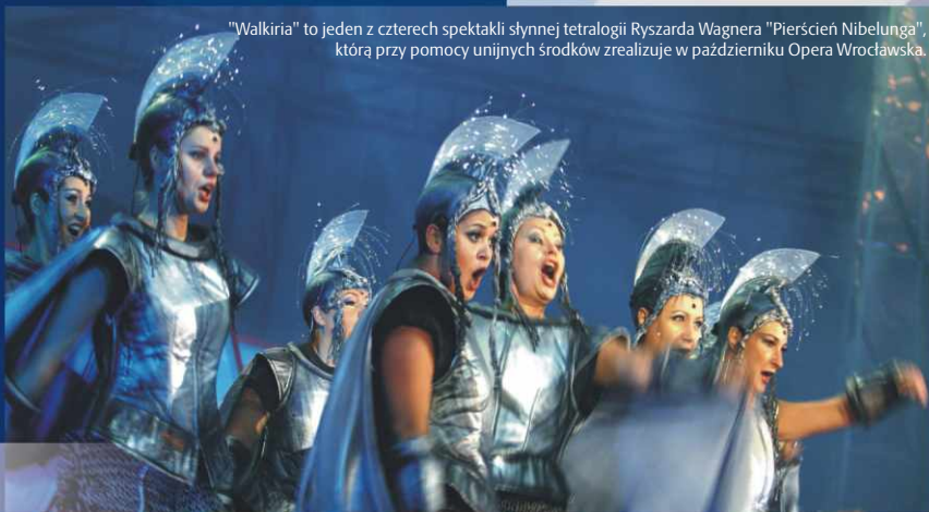
"Walkiria" to jeden z czterech spektakli słynnej tetralogii Ryszarda Wagnera "Pierścienia Nibelunga", którą przy pomocy unijnych środków zrealizuje w październiku Opera Wrocławska.

Już za kilka dni (6 października) spektaklem "Złoto Renu" w Hali Ludowej rozpocznie się jedno z największych wydarzeń kulturalnych Dolnego Śląska – Festiwal Wagnerowski. Realizacja słynnej tetralogii Ryszarda Wagnera Pierścienia Nibelunga, której podjęła się Opera Wrocławska, jest przedsięwzięciem wyjątkowym. W niepowtarzalnej scenerii Hali Stulecia miłośnicy opery z całej Europy będą mogli obejrzeć cztery spektakle, które zaangażują ponad 300 artystów. Szacuje się, że wielki dramat muzyczny Wagnera zobaczą 12 tys. osób, w tym nawet 6 tys. widzów zagranicznych. W tym wydarzeniu swój udział będzie miała Unia Europejska.