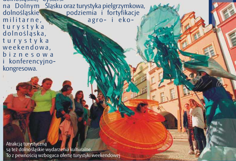
Atrakcją turystyczną są też dolnośląskie wydarzenia kulturalne. To z pewnością wzbogaca ofertę turystyki weekendowej