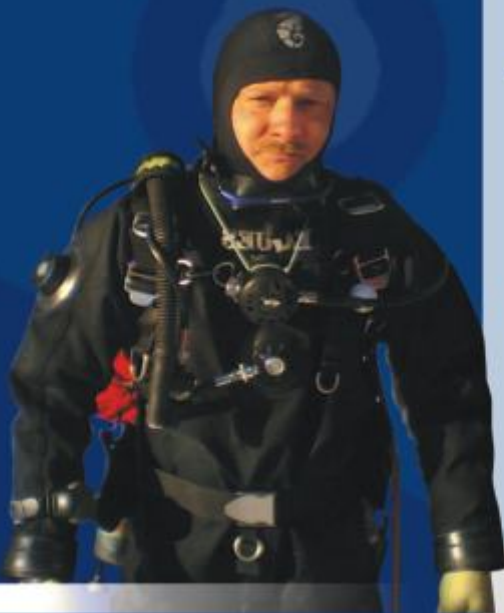
Szkoła Nurkowania z Legnicy rozpoczęła działalność w lutym tego roku.