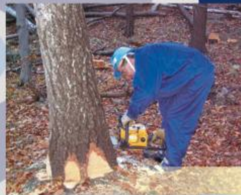
W Wałbrzychu, Kłodzku i Jeleniej Górze zorganizowano m.in. kursy drwal-pilarz. łącznie na Dolnym Śląsku w ramach Działania 2.3 ZPORR pomocą objętych ma zostać 1441 osób.

Z kolei Agencja Rozwoju Regionalnego ARLEG w Legnicy prowadzi dwa projekty kończące się subsydiowaniem zatrudnienia łącznie dla ponad 100 osób (kształcenie zawodowe na terenach wiejskich Doliny Środkowej Odry i Pogórza Kaczawskiego w przedsiębiorstwach spoza sektora MŚP oraz z sektora MŚP).