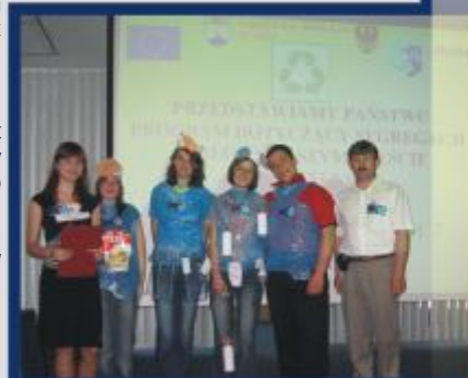
I miejsce w konkursie zajęła drużyna z Publicznego Gimnazjum nr 1 w Ząbkowicach Śląskich i jej projekt „Śmieć śmieciowi nierówny - segregujemy odpady”