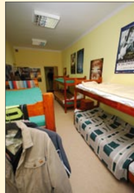
W ośmiu salach noclegowych może znaleźć schronienie 60 osób, w tym trzy niepełnosprawne.

Artykuł nagrodzony w konkursie dla dziennikarzy „Tak działa ZPORR na Dolnym Śląsku”