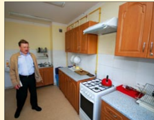
Na każdym z pięter uruchomiono wyposażone w pełni kuchnie i jadalnie.

Od lipca do listopada 2005 wyremontowano cały budynek byłej izby wytrzeźwień. Trzykondygnacyjny obiekt zyskał