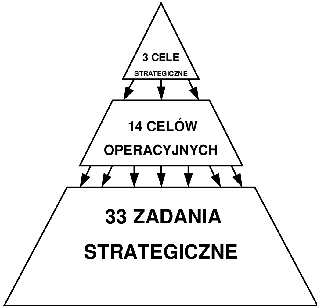
Rysunek 5. Struktura celów i zadań strategicznych Gminy Bolków.

projektu. Pierwsza ranga (przed przecinkiem) dotyczy zatem terminu opracowania ww. programu, natomiast druga (po przecinku) terminu realizacji zadania.