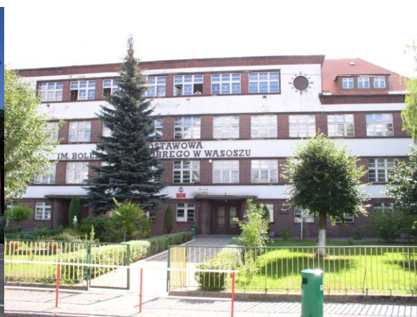
Publiczna Szkoła Podstawowa w Wąsoszu