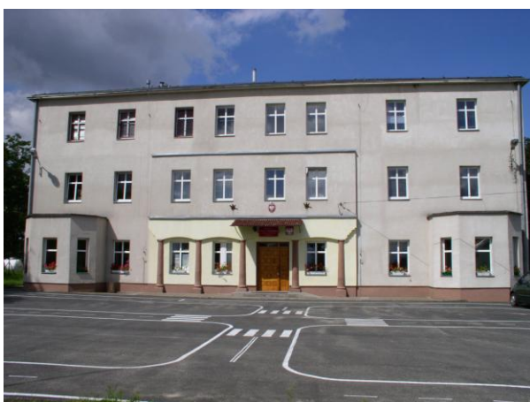
Publiczna Szkoła Podstawowa w Płaskach