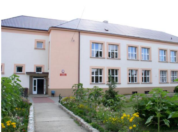
Publiczna Szkoła Podstawowa w Czarnoborsku

budżetowych: Zakład Gospodarki Komunalnej i mieszkaniowej w Wąsoszu oraz Zakład Wodociągów i Kanalizacji w Wąsoszu a także samorządowej instytucji kultury Zespołu Placówek Kultury w Wąsoszu.