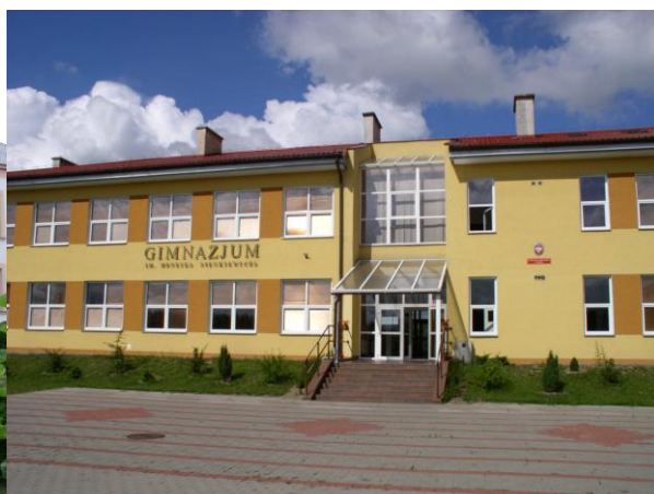
Publiczne Gimnazjum w Wąsoszu