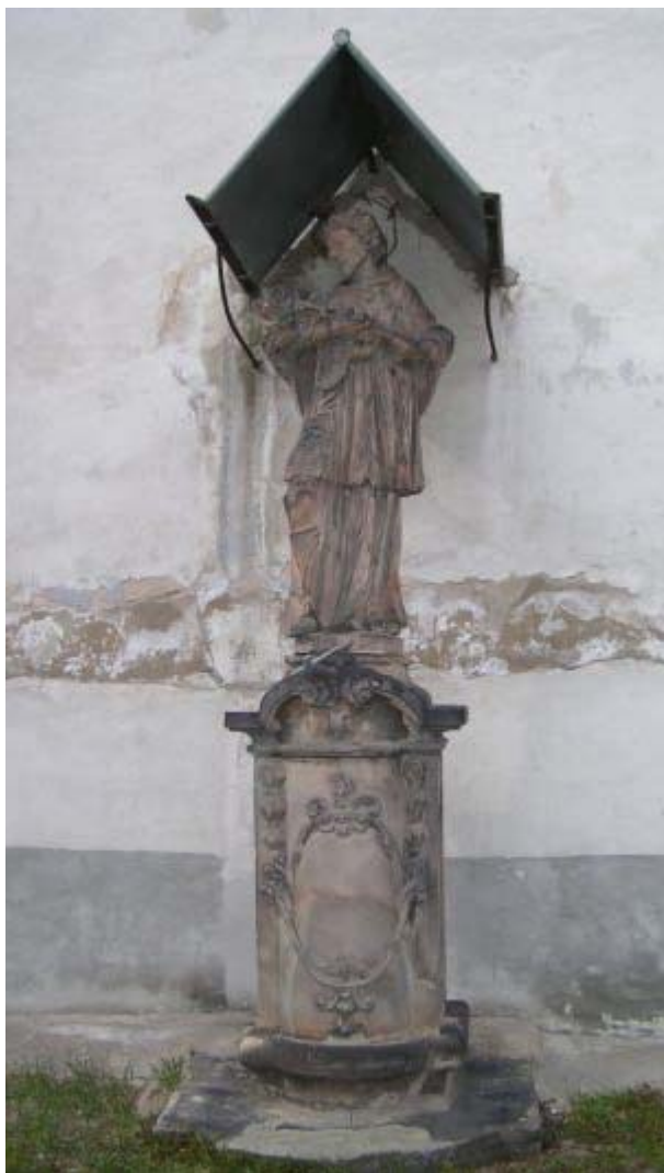
Ryc. 4: Rzeźba św. Jana Nepomucena na zewnątrz kościoła w Piekarach.