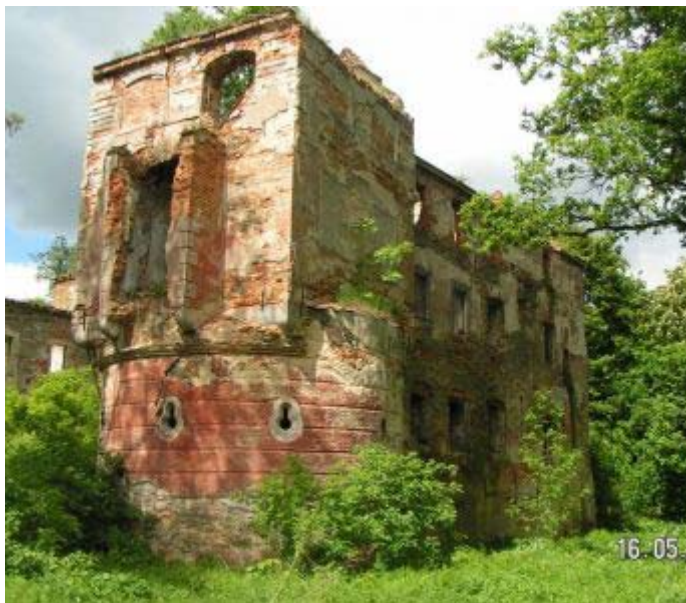
Ryc. 2: Ruiny pałacu w Pielaszkowicach z 2 połowy XVII wieku i początku XIX wieku.