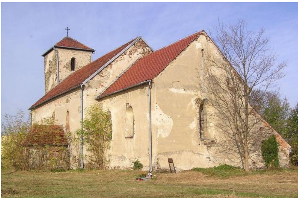
Ryc. 3: Kościół św. Urszuli w Udaninie z ok. 1250 roku.