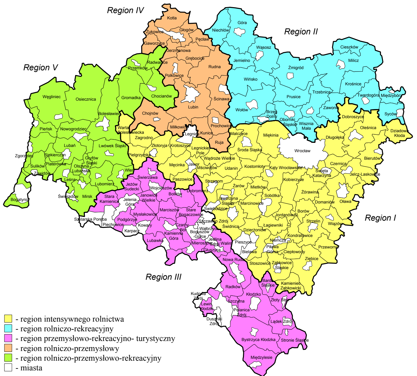
Rys. 1. Regiony funkcjonalne obszarów wiejskich Dolnego Śląska