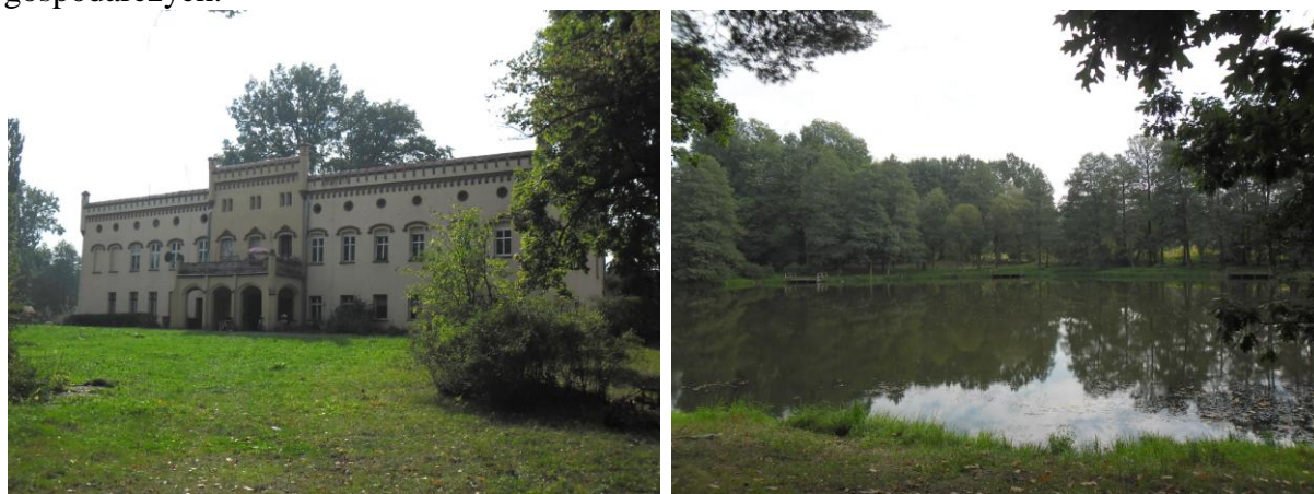
Rys.8,9. Zrewitalizowane w 2009 założenie pałacowo-parkowe w Zarębie Górnej.

W zachowanych częściowo założeniach parkowych można nadal odczytać fragmenty dawnych układów kompozycyjnych m.in. w postaci alei lipowych, grabowych czy z kasztanowców pospolitych zastosowanych m.in. w Jałowcu, Leśnej Baworowie, Pobiednej, Smolniku. W niektórych zespołach znajdują się pozostałości lub zachowane w większości układy wodne w postaci połączonych kanałami i rowami melioracyjnymi stawów np. w Kościelnikach Górnych, Grabiszycach Górnych, Włosieniu Dolnym, Zarębie Górnej.