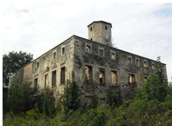
Rys. 7 Ruina pałacu, Piszczowice Średnie.