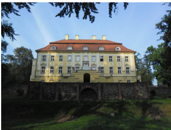
Rys. 6 Pałac w Biedrzychowicach.

Po II wojnie światowej dawne majątki ziemskie powiatu lubańskiego zostały przejęte przez Państwowe Gospodarstwa Rolne, budynki folwarki wykorzystywano do hodowli, przechowywania maszyn rolniczych, pałace, budynki zarządców majątku pełniły funkcje administracyjne, oświatowe lub mieszkalne. Po likwidacji państwowych gospodarstw rolnych agencja nieruchomości rolnych część założeń rezydencjonalnych powiatu lubańskiego przekazała nieodpłatnie gminom, inne wystawiła na sprzedaż. Niektóre obiekty pałacowe od czasów powojennych pełniły funkcje oświatowe: w pałacu w Olszynie Dolnej powstało przedszkole, w Grabiszycach Średnich – szkoła podstawowa funkcjonująca do dzisiaj, pałac w Biedrzychowicach stanowi do dzisiaj siedzibę szkół rolniczych (Rys.6), we Włosieniu Górnym szkołę zawodową założoną w 1953 przekształcono na Młodzieżowy Ośrodek Wychowawczy, który otwarto w 2014 r. Pełnienie przez te obiekty funkcji oświatowych zapewniły im zachowanie w dobrym stanie technicznym budynków oraz utrzymanie w dobrym stanie zdrowotnym drzew parkowych.