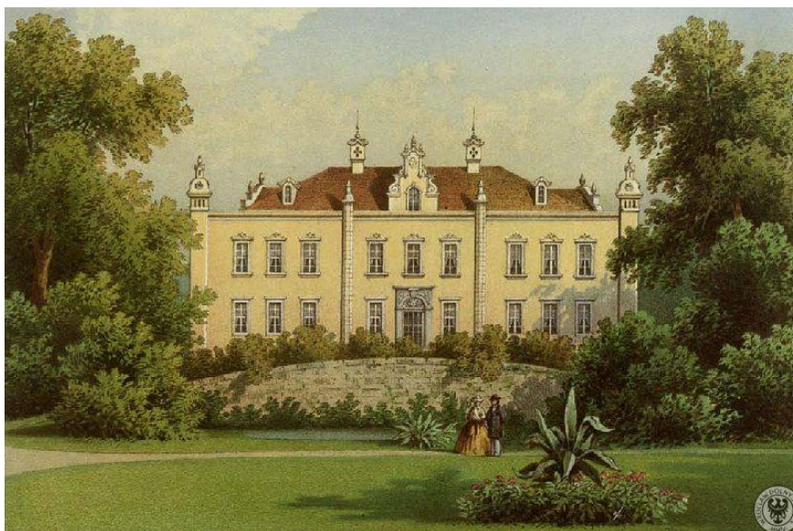
Rys. 4 Pałac w Zarębie Dolnej na litografii Ferdinanda Pazelta z poł. XIX w. z teki Alexandra Dunckera, [z:] http://www.dokumentyslaska.pl/litografie%20pazelt/litera%20b.html .

Przy nowo wznoszonych lub przebudowywanych rezydencjach zakładano ogrody i parki, wykorzystywano do tego istniejący drzewostan, naturalne ukształtowanie terenu czy bliskość rzeki. Większość założeń zyskała charakter naturalistyczny, łagodne linie ścieżek prowadzą do polan widokowych, nad brzegi stawów, prowadzą przez malownicze nasadzenia grup drzew liściastych, głównie dębów szypułkowych, buków pospolitych, lip drobnolistnych. Na początku XX w. do założeń parkowych zaczęto wprowadzać drzewa i krzewy iglaste, cyprysiki ( Chamaecyparis ), żywotniki ( Thuja ), świerki ( Picea ), jodły ( Abies ), daglezie ( Pseudotsuga ). Z introdukowanych gatunków obcych w parkach sadzono pojedyncze egzemplarze takich drzew jak cyprysik nutkajski Chamaecyparis nootkatensis (Biedrzychowice, Smolnik), gledicja trójcierniowa Gleditsia triacanthos (Włosień Dolny), magnolia japońska Magnolia kobus (Włosień Dolny), miłorząb japoński Ginkgo biloba (Szyszkowa Górna), platan klonolistny Platanus acerifolia (Biedrzychowice, Włosień Górny, Zaręba Górna), tulipanowiec amerykański Liriodendron tulipifera (Biedrzychowice, Smolnik), skrzydłoorzech kaukaski Pterocarya fraxinifolia (Zaręba Dolna).