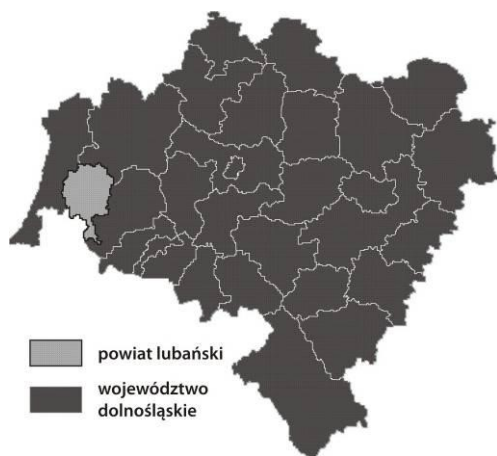
Rys. 2 Położenie powiatu lubańskiego na tle województwa dolnośląskiego. Oprac. własne.