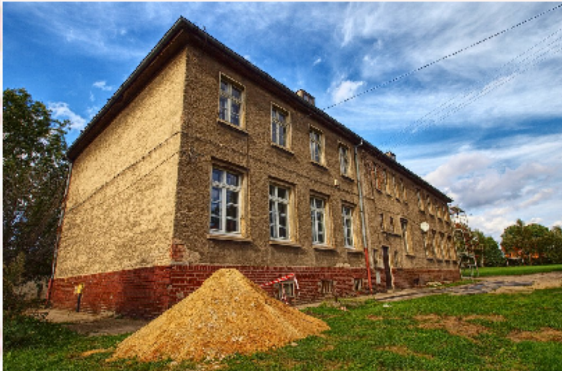
Budynek nr 74 w Jędrzychowicach