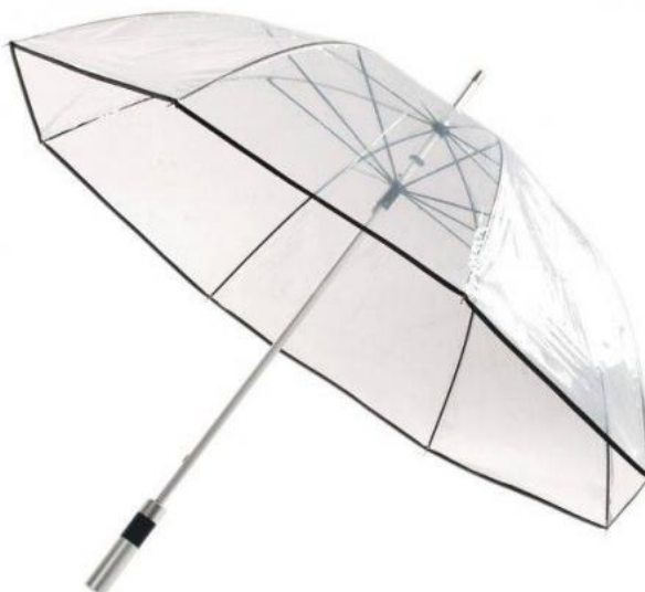
Rys. 5 Przykładowy wygląd parasola