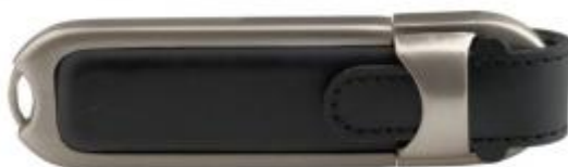
Rys. 4 Przykładowy wygląd pendriva