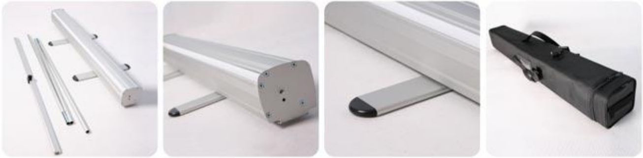
Rys. 1 Przykładowy wygląd roll up'a