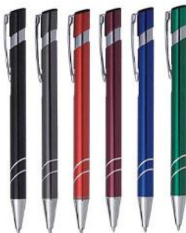
Rys. 3 Przykładowy wygląd długopisu