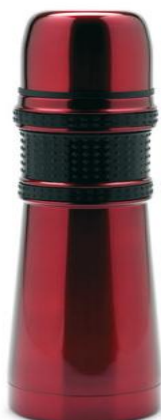
Rys. Przykładowy wygląd termosu

Na materiałach promocyjnych będą wykorzystywane następujące znaki graficzne w wersji kolorowej bądź monochromatycznej: