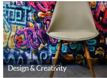
Design & Creativity

HOME ABOUT US ▾ MEMBERS ▾ WORKING GROUPS EVENTS ▾ NEWS PARTNER SEARCHES CONTACT US ▾