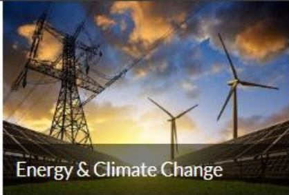
Energy & Climate Change

HOME ABOUT US ▾ MEMBERS ▾ WORKING GROUPS EVENTS ▾ NEWS PARTNER SEARCHES CONTACT US ▾