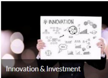
Innovation & Investment