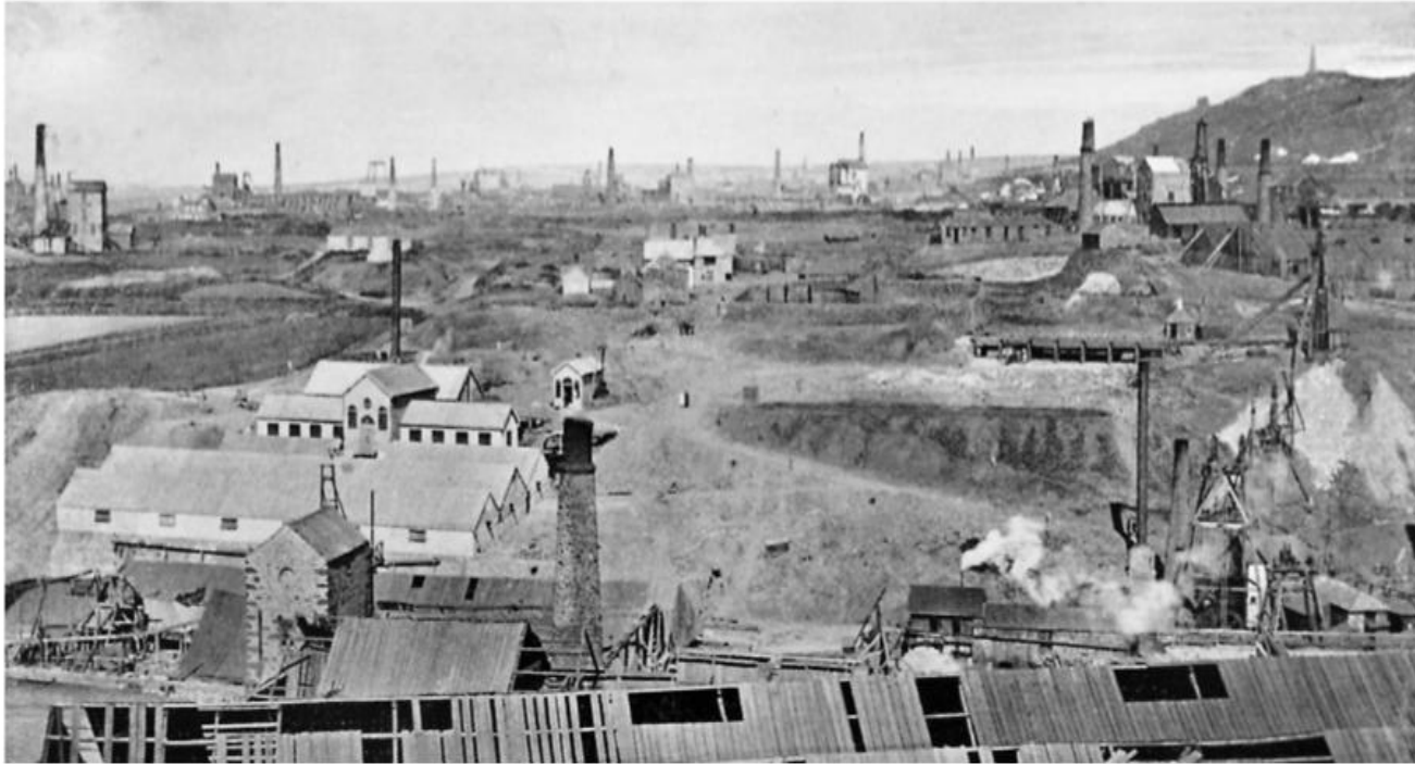
Camborne-Redruth mining district c. 1900