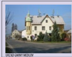
URZĄD GMINY MEDLOV