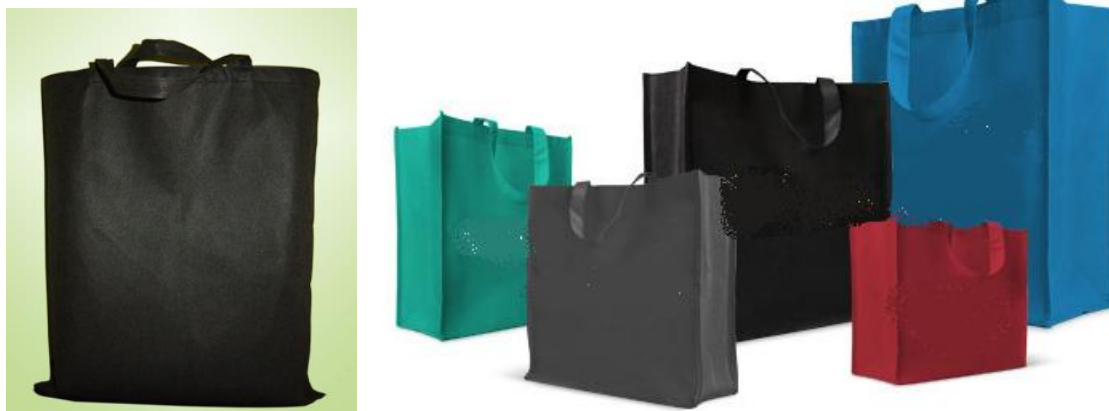
Rys. 10 Przykładowy wygląd torby promocyjnej