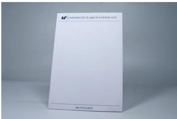
Rys. 9 Przykładowy wygląd notesu A4

Projekt współfinansowany przez Unię Europejską ze środków Europejskiego Funduszu Rozwoju Regionalnego oraz ze środków budżetu państwa w ramach Pomocy Technicznej Programu Operacyjnego Współpracy Transgranicznej Republika Czeska – Rzeczpospolita Polska 2007-2013