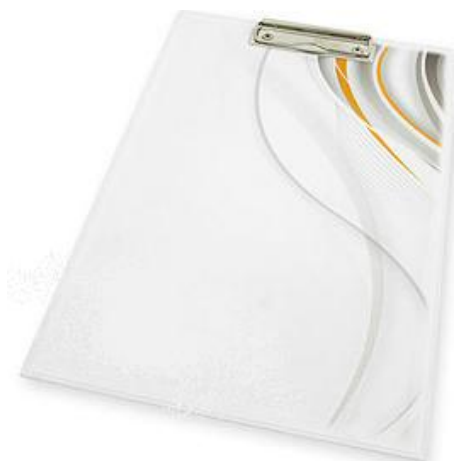
Rys. 7 Przykładowy wygląd podkładki z klipsem