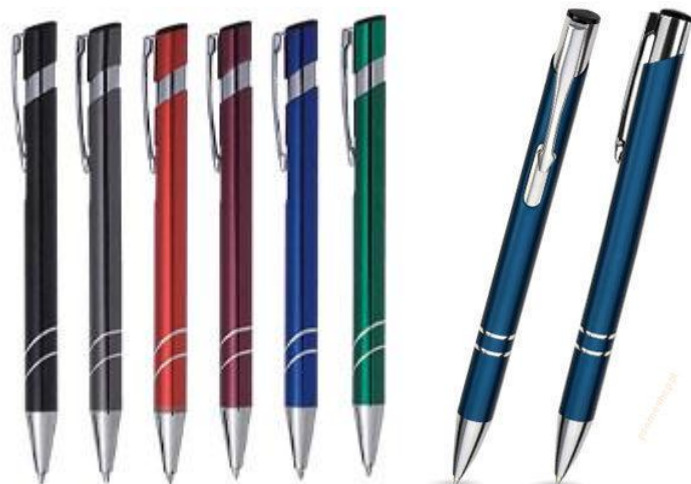
Rys. 8 Przykładowy wygląd długopisu