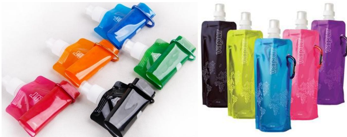
Rys. 5 Przykładowy wygląd składanej butelki na wodę