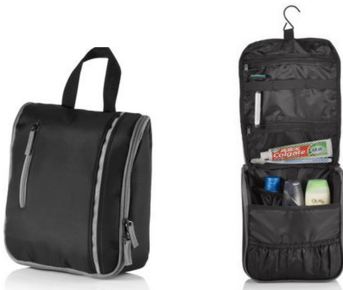
Rys. 1 Przykładowy wygląd kosmetyczki podróżnej