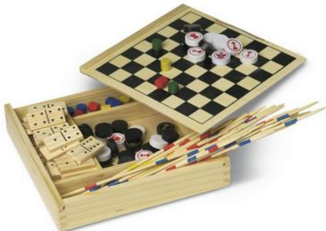
Rys. 4 Przykładowy wygląd zestawu gier drewnianych w pudełku