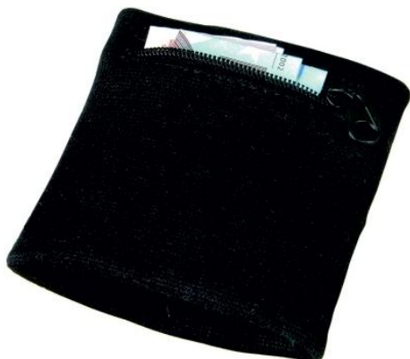
Rys. 6 Przykładowy wygląd opaski na rękę z portfelem

Projekt współfinansowany przez Unię Europejską ze środków Europejskiego Funduszu Rozwoju Regionalnego oraz ze środków budżetu państwa w ramach Pomocy Technicznej Programu Operacyjnego Współpracy Transgranicznej Republika Czeska – Rzeczpospolita Polska 2007-2013