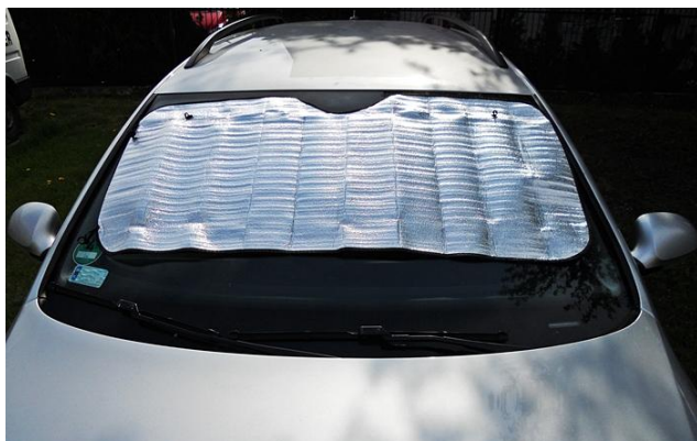
Rys. 3 Przykładowy wygląd osłony na przednią szybę samochodową

Projekt współfinansowany przez Unię Europejską ze środków Europejskiego Funduszu Rozwoju Regionalnego oraz ze środków budżetu państwa w ramach Pomocy Technicznej Programu Operacyjnego Współpracy Transgranicznej Republika Czeska – Rzeczpospolita Polska 2007-2013