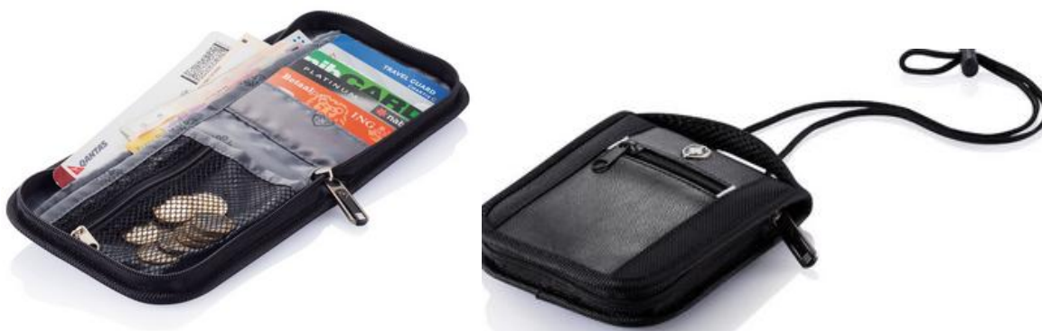
Rys. 2 Przykładowy wygląd portfela podróżnego