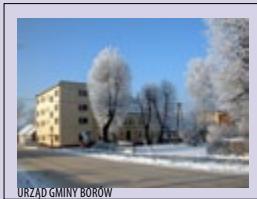
URZĄD GMINY BORÓW