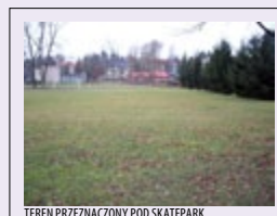
TEREN PRZEZNACZONY POD SKATEPARK