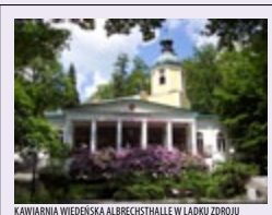
KAWIARNIA WIEDERSKA ALBRECHTSHALLE W ŁĄDKU ZDRÓJU