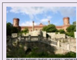
PALAC KRÓLOWY MARIANNY ORAŃSKIEJ W KAMIENIEC ZĄBKOWICKIM