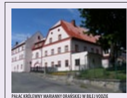
PALAC KRÓLOWY MARIANNY ORAŃSKIEJ W BÍLÉJ VODZIE