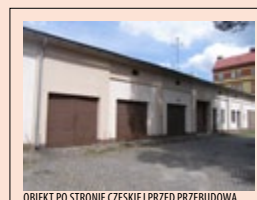
OBIEKT PO STRONIE CZESKIEJ PRZED PRZEBUDOWĄ

Celem projektu jest stworzenie zaplecza technicznego dla działań ratownictwa medycznego na pograniczu polsko-czeskim. Po stronie polskiej planowany jest zakup 2 ambulansów z wyposażeniem z miejscem stacjonowania w Kamiennej Górze oraz w Kowarach, a po stronie czeskiej przebudowa ośrodka Pogotowia Ratunkowego w Trutnowie w celu stworzenia zaplecza dla dwóch zespołów wyjazdowych ratowników i dyspozytorni. W ramach projektu przeprowadzone zostaną także wspólne staże wymienne i kursy językowe dla personelu medycznego oraz wspólne ćwiczenia ratowników, powstaną: wspólny słownik dla personelu medycznego zawierający podstawowe sformułowania z zakresu ratownictwa medycznego, standardowe ujednolicone formularze dwujęzyczne w karetkach oraz broszury dwujęzyczne informujące o sposobie udzielania oraz wzywania pomocy. W ten sposób projekt przyczyni się nie tylko do poprawy wyposażenia służb ratownictwa medycznego, lecz również do poszerzenia wiedzy oraz zdobywania nowych doświadczeń przez personel medyczny, a tym samym do poprawy jakości świadczonych usług oraz pogłębienia współpracy pomiędzy pracownikami polskich i czeskich jednostek ratownictwa medycznego, podnosząc poziom bezpieczeństwa na polsko-czeskim pograniczu.