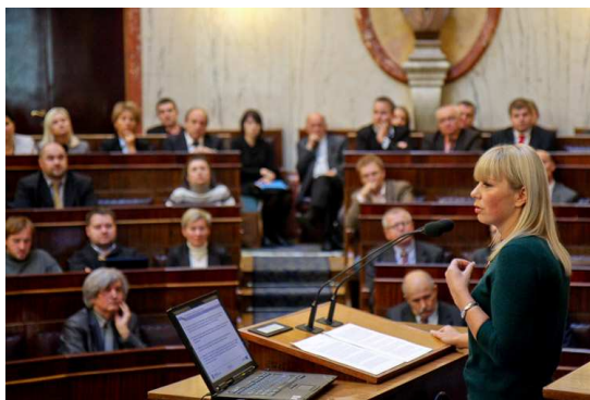
Konsultacje w województwie śląskim, 16.11.12

Konsultacje rozpoczęły się w Katowicach 16 listopada, a zakończyły 19 grudnia spotkaniem w Warszawie (harmonogram spotkań w załączeniu). Należy podkreślić, że konferencje zostały przeprowadzone zanim dokument zaakceptowała Rada Ministrów, co gwarantowało faktyczny wpływ zainteresowanych na kształt dokumentu. Nowość i atrakcyjność tematyki zapewniła każdorazowo wysoką frekwencję, zaś udział przedstawicieli kierownictwa MRR oraz władz województw wysoką rangę spotkań.