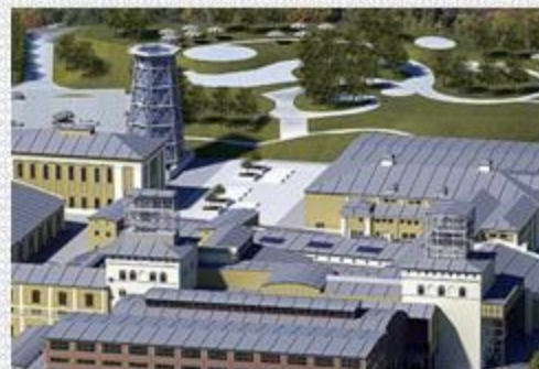
Park Wielokulturowy Stara Kopalnia