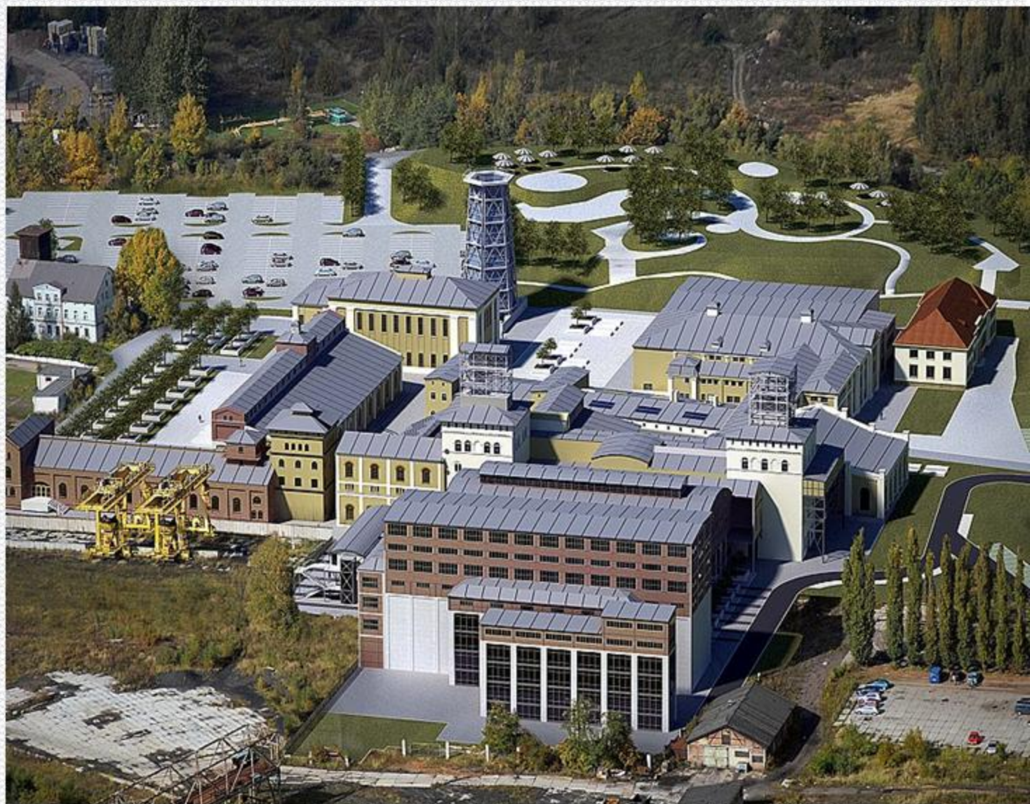
Park Wielokulturowy Stara Kopalnia wizualizacja całości zamierzenia