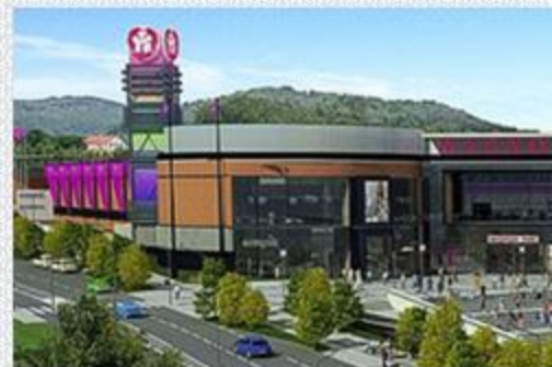
Galeria Magnolia Park