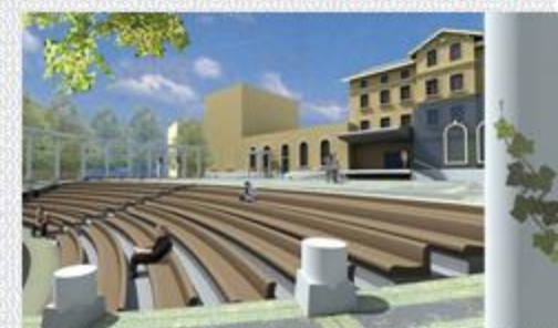
Galeria Victoria i rewitalizacja Śródmieścia