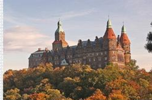
Centrum Kongresowe Zamek Książ