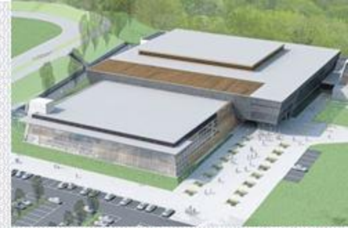
Centrum Sportowo – Rekreacyjne Aqua-Zdrój