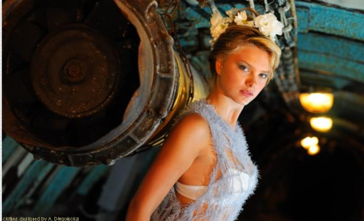
clothes designed by A. Dągołęcka